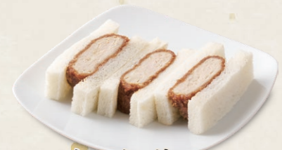
メンチかつサンド [3切] 400円(税込432円)