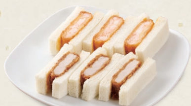
ミックスサンド(ヒレ・エビ) [各3切] 925円(税込999円)