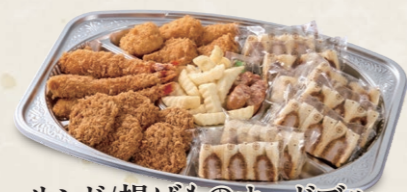
サンド/揚げものオードブル 一口ヒレかつ・海老フライ・クリームコロッケ ウインナー・ハーフサンド・フレンチポテト 6,200円(税込6,696円)~