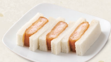
エビかつサンド [3切] 490円(税込529円)