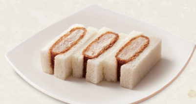
ヒレかつサンド [3切] 450円(税込486円) [6切] 885円(税込955円)