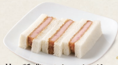
甘い誘惑ハムかつサンド [3切] 460円(税込496円)