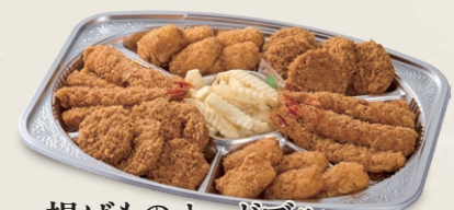
揚げものオードブル 一口ヒレかつ・海老フライ・クリームコロッケ フレンチポテト 5,050円(税込5,454円)~